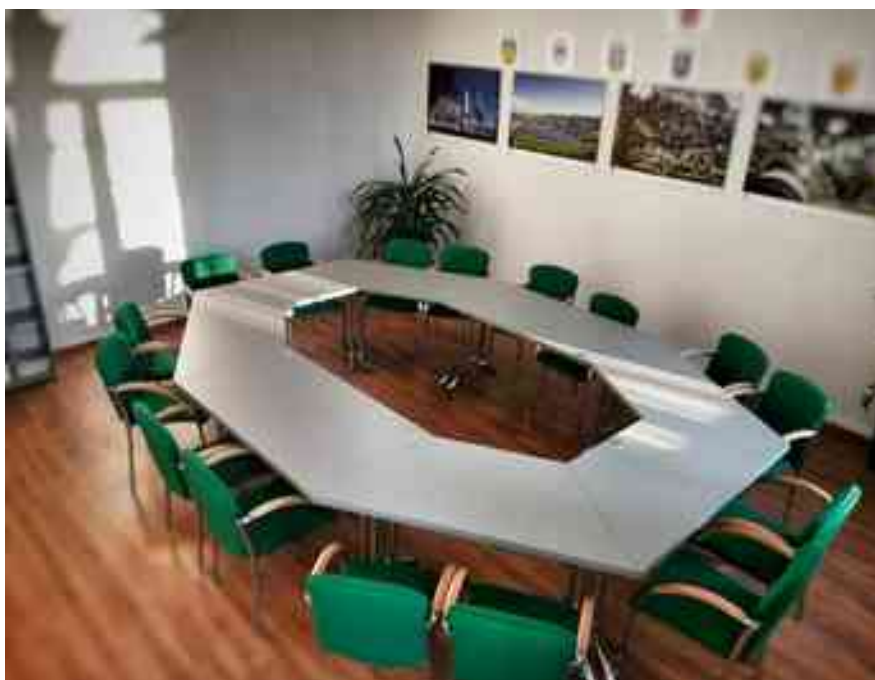
Sala posiedzeń Komisji Rady Powiatu

Komisje Rady Powiatu na swoich posiedzeniach w sposób bardzo szczegółowy analizowały każdy temat ujęty w planie pracy na rok 2022. Planowane tematy zostały w pełni zrealizowane. Szczegóły z posiedzeń znajdują się w protokołach, które na bieżąco udostępniane są na stronie BIP Starostwa Powiatowego w Dzierżoniowie.